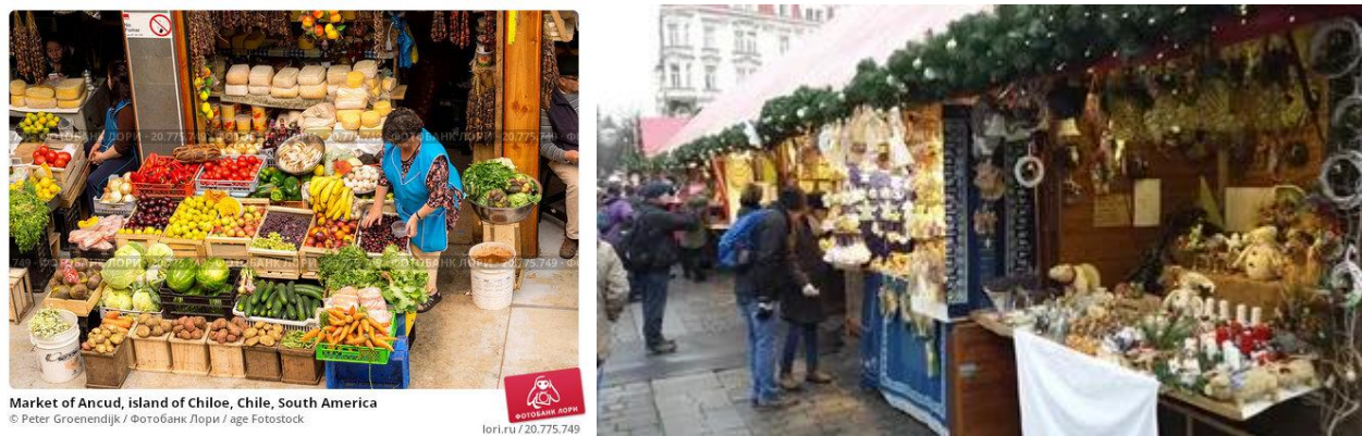
Рис. 2. Современные ярмарки за рубежом [1]. Fig. 1. Modern fairs abroad [1].

Проведение ярмарок известно за рубежом странах и России с давних времен. Изначально их приурочивали к праздникам или праздничным мероприятиям, народным гуляниям, объединяющим городских и сельских жителей. Современные ярмарки имеют более цивилизованный вид, инфраструктуру, условия торговли и отдыха посетителей (рис. 2).