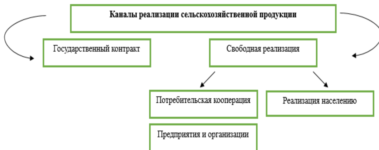
Рис. 1. Каналы реализации продукции сельскохозяйственными организациями Fig. 1. Channels for selling products by agricultural organizations

организациям, потребительская кооперация, населению на ярмарках и рынках (рис. 1).