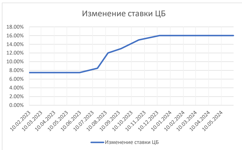
Рисунок 2. Изменения ключевой ставки Центробанка за 2023г. — первое полугодие 2024г. Figure 2. Changes in the Central Bank's key rate for 2023 — the first half of 2024

принимать решения о повышении ключевой ставки до 15.12.2023г., которая достигла максимума в размере 16% за период исследования [3].