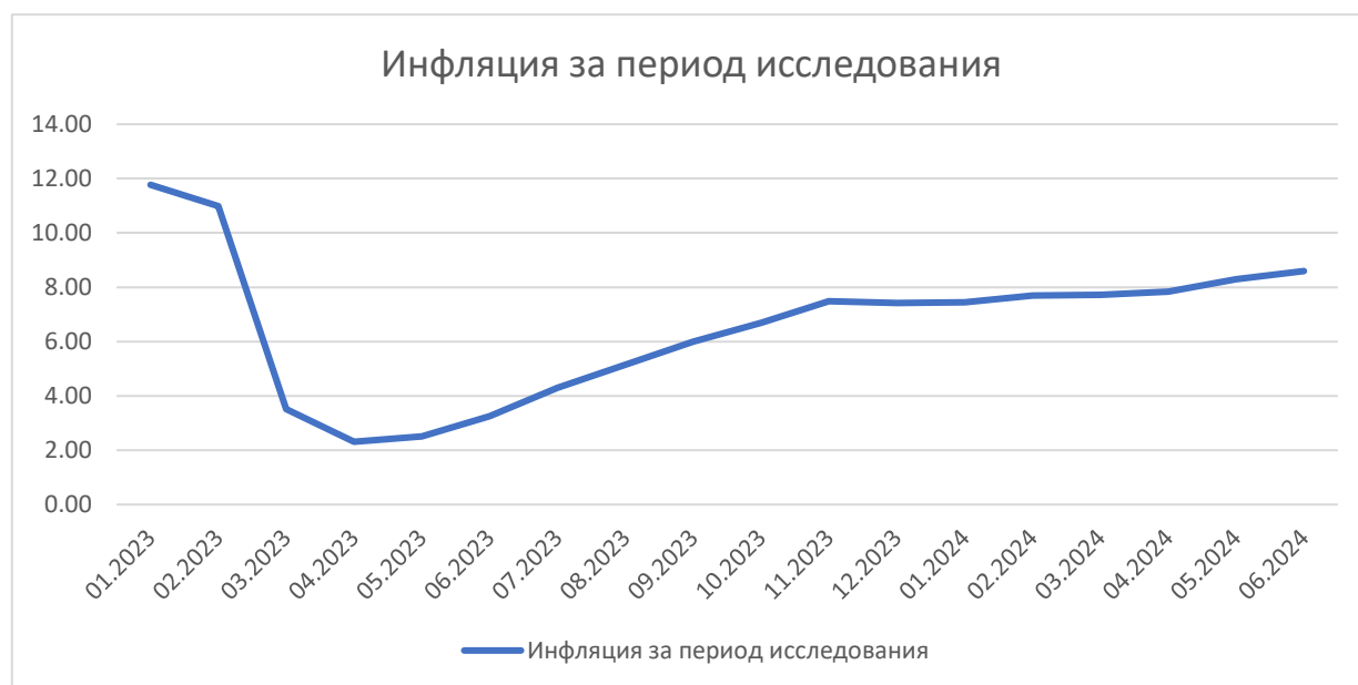
Рисунок 1. Инфляция за период исследования Figure 1. Inflation during the study period

Инфляционное таргетирование означает экономическую политику, при которой органы денежно-кредитного регулирования выполняют функции центрального банка, устанавливая целевые значения по инфляции на определенный период времени [2].